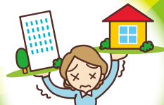
仕事と家庭の両立