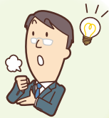
知識、ノウハウの不足