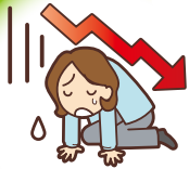
失敗したときのリスク