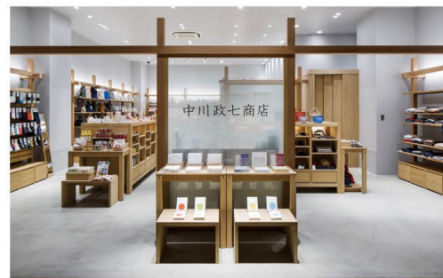
中川政七商店 アミュプラザおおいた店